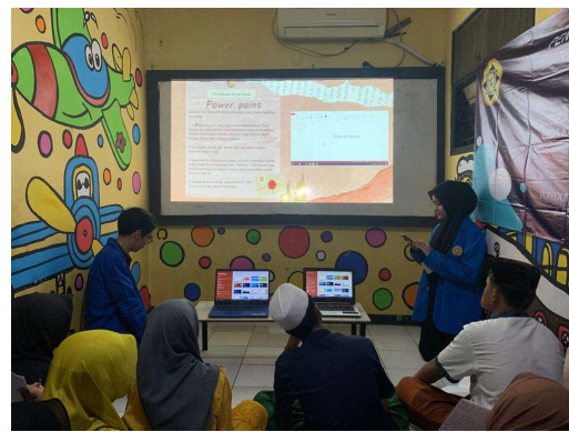
Gambar penjelasan materi

Pengunaan Microsoft Power Point pasti akan terus berkelanjutan baik dalam dunia pendidikan, perniagaan dan juga dunia kerja pasti akan terus digunakan nantinya. Diharapkan para peserta kegiatan dapat ikut mengembangkan tentang pemahaman penggunaan Microsoft Power Point sehingga informasi yang disampaikan dapat terus ditingkatkan. Dan untuk kerja sama lainnya, diharapkan tim pengabdian kepada masyarakat dari program studi Teknik Informatika Universitas Pamulang dapat kembali memberikan solusi-solusinya terhadap masalah-masalah yang dihadapi dalam masyarakat yang berkaitan dengan teknologi infomasi.