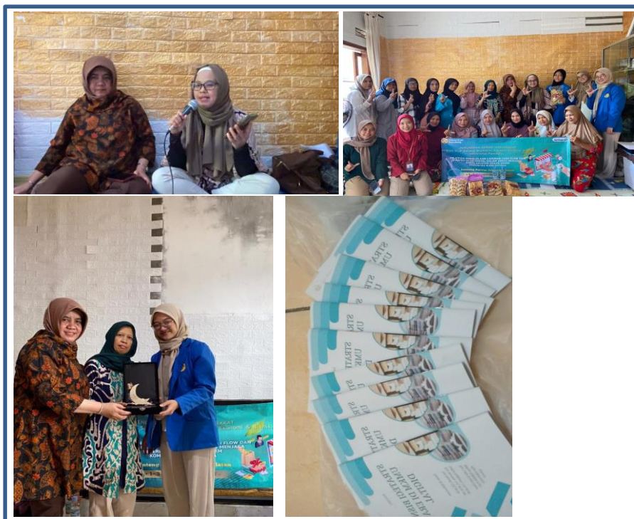
Gambar 2. Narasumber dan Peserta dalam Kegiatan Pengabdian kepada Masyarakat

Pada kegiatan PkM ini, peserta mendapatkan materi dan praktik langsung dari para pengabdian yaitu dosen Universitas Pamulang sebagai narasumber, selain menjadi pengajar, para dosen tersebut juga pemilik usaha sehingga dapat memperkuat materi yang diberikan.