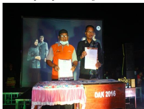
Gambar 8. proses dokumentasi hasil penandatanganan MOU