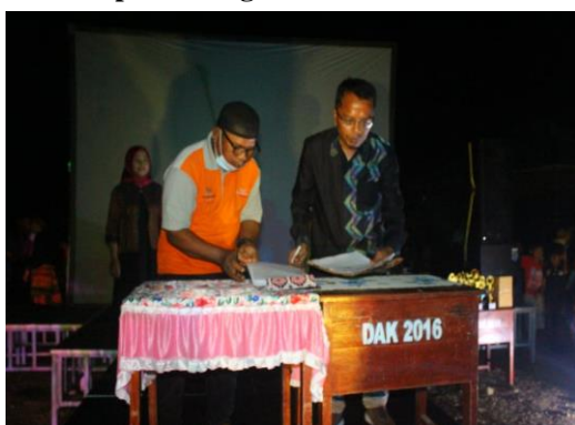
Gambar 7. penandatanganan MOU atau penetapan kelurahan ntobo sebagai Kelurahan binaan, antara ketua Lembaga sekolah tinggi ilmu ekonomi bima dan bapak lurah ntobo