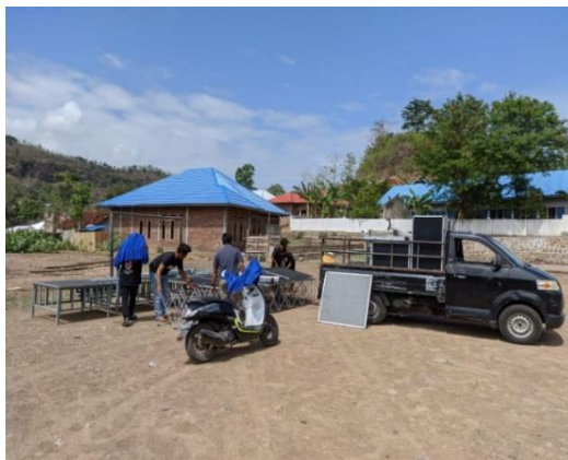
Gambar 2. Proses Persiapan Panggung

Tahap persiapan dari kegiatan ini adalah pembuatan panflet dan pengurusan administratif dan penempatan tempat kegiatan yang dilakukan di lapangan voli kelurahan NTOBO, serta penentuan konsep kegiatan dan layout yang nantinya menjadi konsep kegiatan, serta tidak lupa pula penentuan waktu pelaksanaan dan rundown acara selain itu persiapan peralatan dan perlengkapan serta pendataan peserta adalah hal yang tidak kalah penting pula.