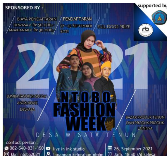
Gambar 4. Brosur Ntobo Fashion Week

Tahap pelaksanaan kegiatan ini diawali dengan gladi bersih di mana semua peserta akan melakukan pengetestan jalan lalu kegiatan dimulai pada pukul 17.00 s/d 22.00 WITA. sesuai dengan jadwal yang ditentukan, dan pelaksanaan kegiatan berjalan sesuai dengan rundown yang disusun oleh panitia seperti dibawah ini: