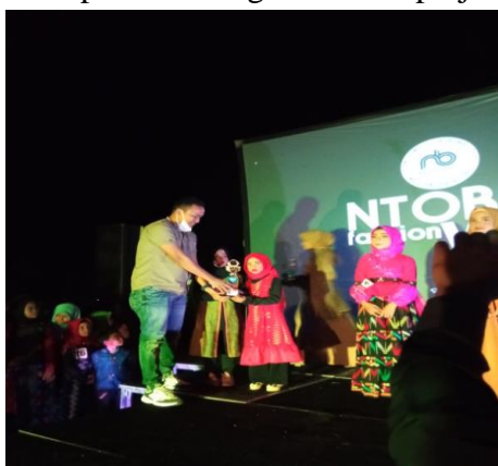
Gambar 9. Penyerahan hadiah kepada kategori anak-anak

Ntobo dan rektor STIE BIMA yang berguna untuk kelanjutan pembinaan UMKM – UMKM yang ada di Ntobo untuk menginovasi produk maupun kegiatan pembinaan lainnya. Selanjutnya dalam kegiatan lomba fahion show tenunannya terdapat pemenang lomba yang dalam kegiatan ini berjumlah tiga orang dengan juara 1,2, dan 3 peserta dari tingkat anak-anak dan berjumlah tiga orang dengan juara 1,2, dan 3 peserta dari tingkat dewasa, Pelaksanaan kegiatan NTOBO FASHION WEEK bertujuan memperkenalkan tenunan ntobo kepada masyarakat luas, selain itu kegiatan NTOBO FASHION WEEK di tujukan sebagai bahan edukasi bagi masyarakat supaya harapan nya akan ada kegiatan sejenis bahkan lebih yang akan di bangun di kemudian hari. Media dan alat yang di sediakan berupa panggung, sound sistem, stand bazar metode yang di gunakan adalah metode FASHION SHOW standar nasional, pementasan musik dan hiburan lain serta penanda tanganan surat perjanjian kerja sama.