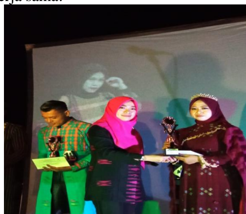
Gambar 6. penyerahan hadiah kepada peserta kategori dewasa