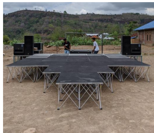
Gambar 3. Proses Penyelesaian Panggung