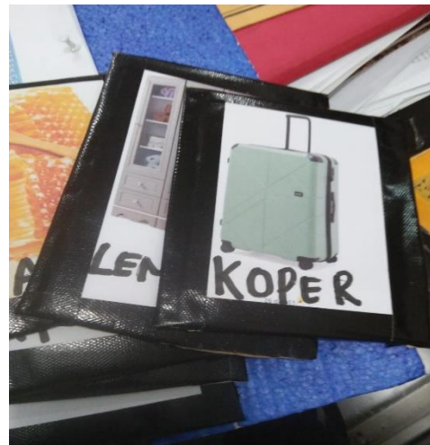
Gambar 1. Persiapan Metode ice breaking Melalui Games Tebak Gambar