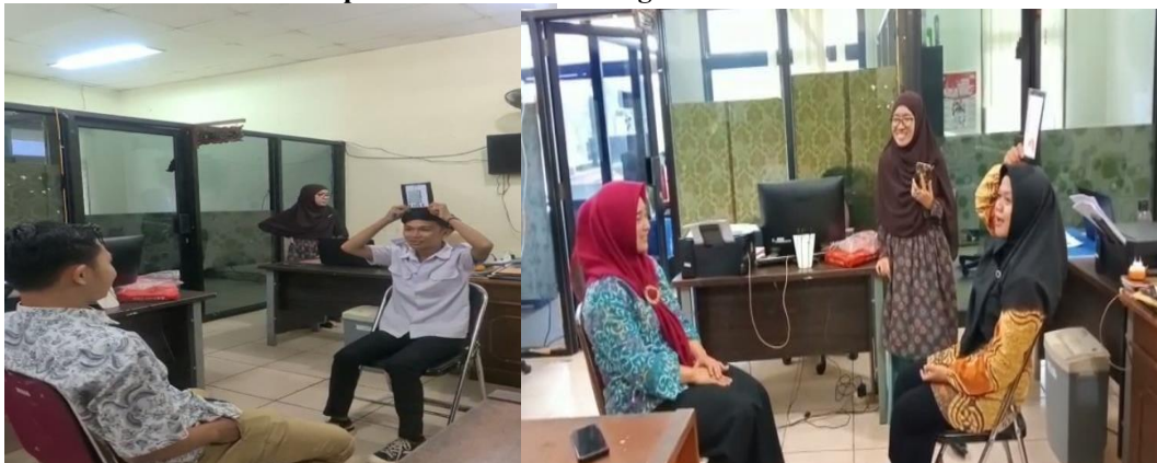
Gambar 2. Bermain Tebak Gambar